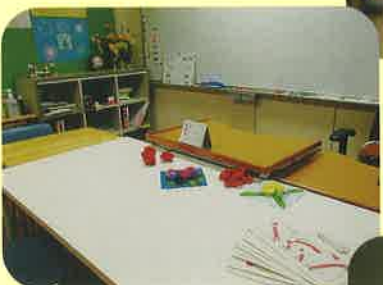
あさひ学級(中学校)