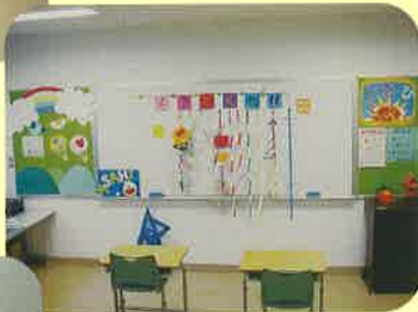
あさひ学級(小学校)