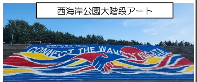
西海岸公園大階段アート

どの活動も暑い中でしたが、地域に貢献することの喜びや楽しさを実感することができました。今後も地域とのつながりを大切にしながら教育活動を行っていきます。