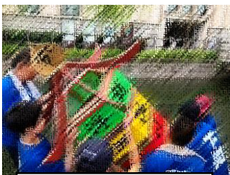
みなと・しもまち・川まつり