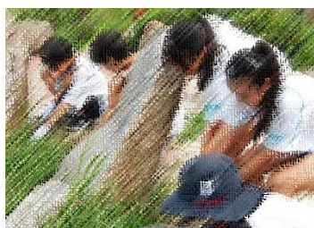
西海岸公園除草作業