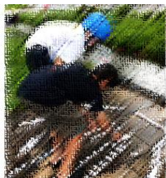
しもまち早川堀★キャンドルナイト